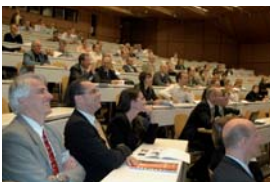
Une salle captivée par les conférences du carrefour Alliance «Nanotechnologies: supersmall is beautiful!» du 21 mai 2008.

«...Cela a été pour MEET Ltd l'occasion d'ouvrir de nouveaux marchés pour son dispositif.»